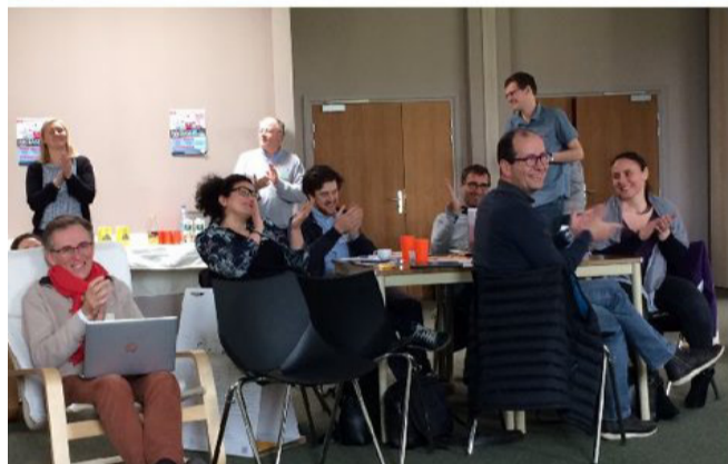
Un marathon du sens avec 6 équipes dynamiques a eu lieu au Centre du Hautmont !

Un hackaton, c'est un marathon pour porteurs de projets, afin de booster leurs arguments. Qu'est-ce qu'un hackasens ? Un hackaton pour des projets porteurs de sens ! Le premier hackasens était organisé au centre spirituel du Hautmont à Mouvaux (59) les 13 et 14 avril 2018.