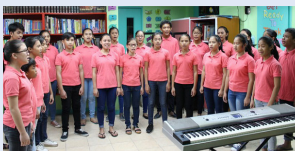
Une trentaine de jeunes de 9 à 17 ans forme le chœur.

■ Entrée libre. Vente d'artisanat philippin. Infos : virvanie.org