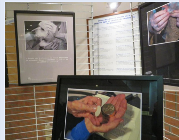
50 photos composent l'exposition.

Jusqu'au 27 mai, la Cathédrale accueille une exposition photographique réalisée par les résidents de la Maison St-Jean à Lille.