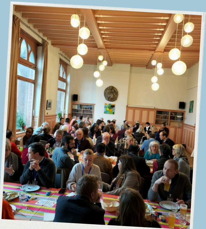
Accueil ICF Hauts de France