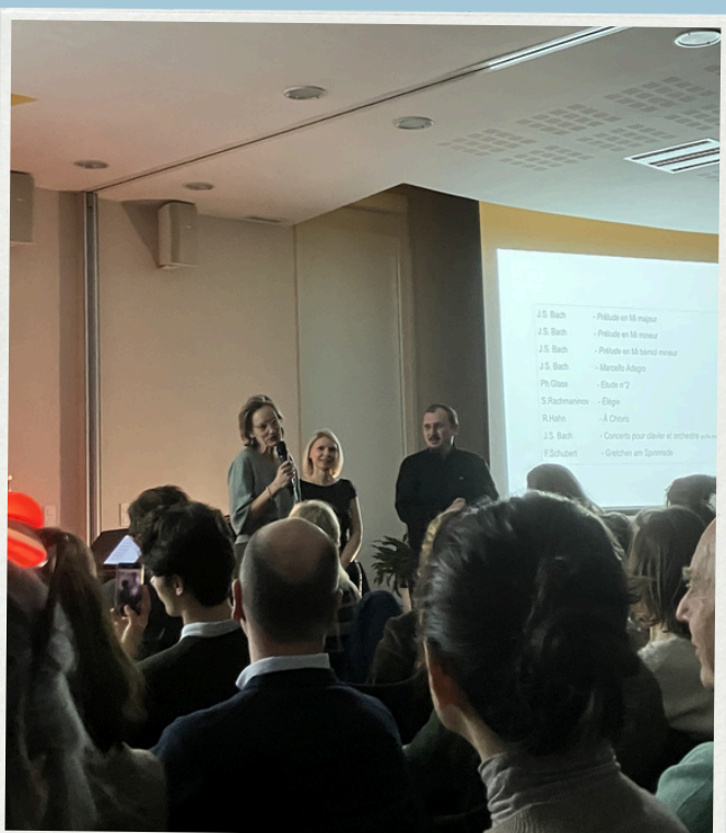
7 variations pour mots et piano