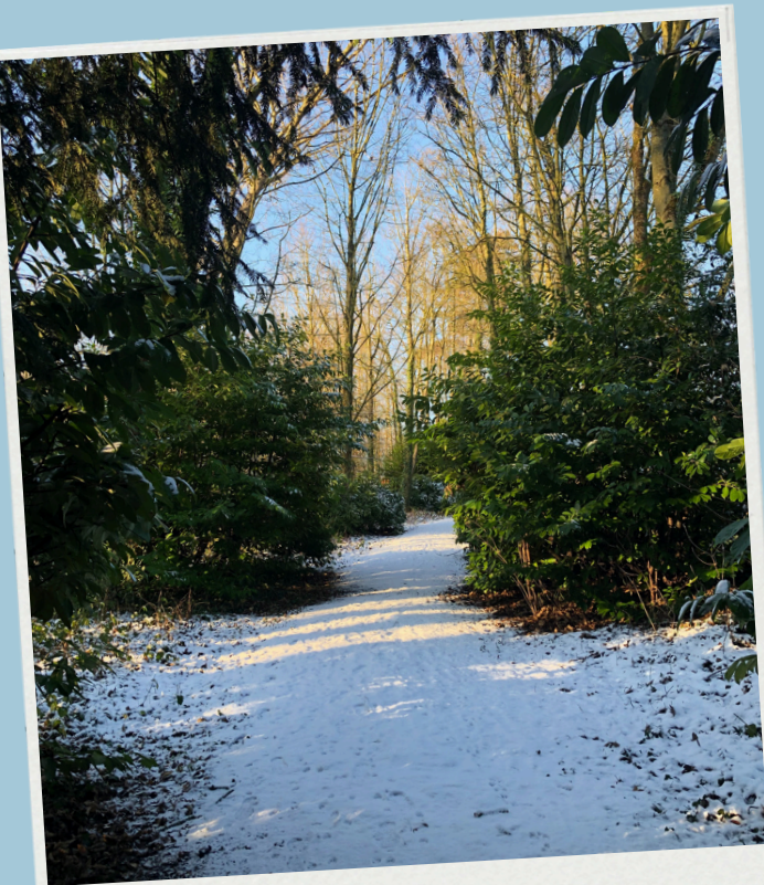
Le Hautmont sous la neige