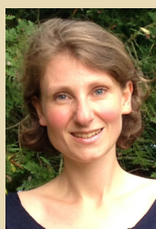
Par Aude Kempf directrice

Ce qui frappe l'œil, au premier instant, c'est la majesté rougeoyante, homogène et avenante de la bâtisse, héritage de l'engagement généreux des fondateurs du Hautmont. Une maison tour à tour havre paisible pour qui traverse les tempêtes de la vie, abri propice à la formation et à la réflexion, pôle de rencontres qui